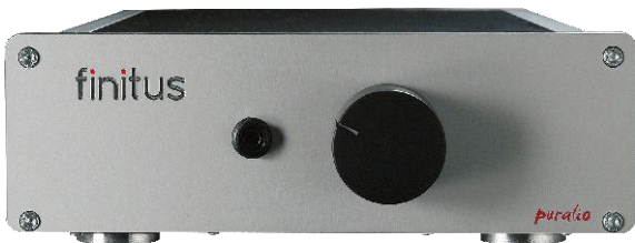
Abbildung 5.2: Frontansicht puralio

Ebenfalls auf der Rückseite befindet sich die Netzanschlussbuchse mit Schalter. Unterhalb der Buchse befindet sich ein kleines Schubfach mit zwei 1 Ampère Sicherungen, von denen die innere im Strompfad liegt und die zweite, äußere, als Ersatz dient.