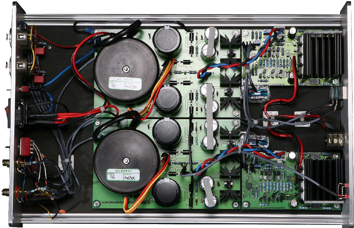
Abbildung 6.1: Innenansicht puralio

Der puralio ist ein Doppelmonoaufbau aus zwei Verstärkerblöcken, wobei jeder von einem eigenen Linearnetzteil versorgt wird.