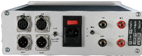
Abbildung 5.1: Rückansicht puralio

Der puralio verfügt über zwei Cinch (RCA) sowie zwei XLR Eingänge auf der Geräterückseite.