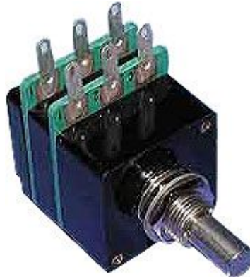
Abbildung 6.4.1: TKD Leitplastikpotentiometer

Das TKD-Poti ist ein hochwertiger Lautstärksteller auf Leitplastikbasis. Eine spiegelglatte "Super-Conductive-Plastic" Schicht erreicht durch die sehr homogene Oberfläche Spitzenwerte in der Auflösung und sorgt für eine sehr hohe Klangqualität. Sechs an die Schleifbahn angebrachte, lasergetrimmte Widerstände garantieren eine hohe und gleichbleibende Genauigkeit des Gleichlaufs und der logarithmischen Kennlinie.